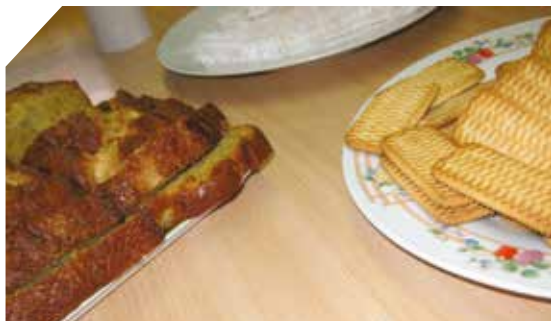
Le cake, à gauche, servi lors d'une pause.

Puis ajoutez en mélangeant au fur et à mesure :