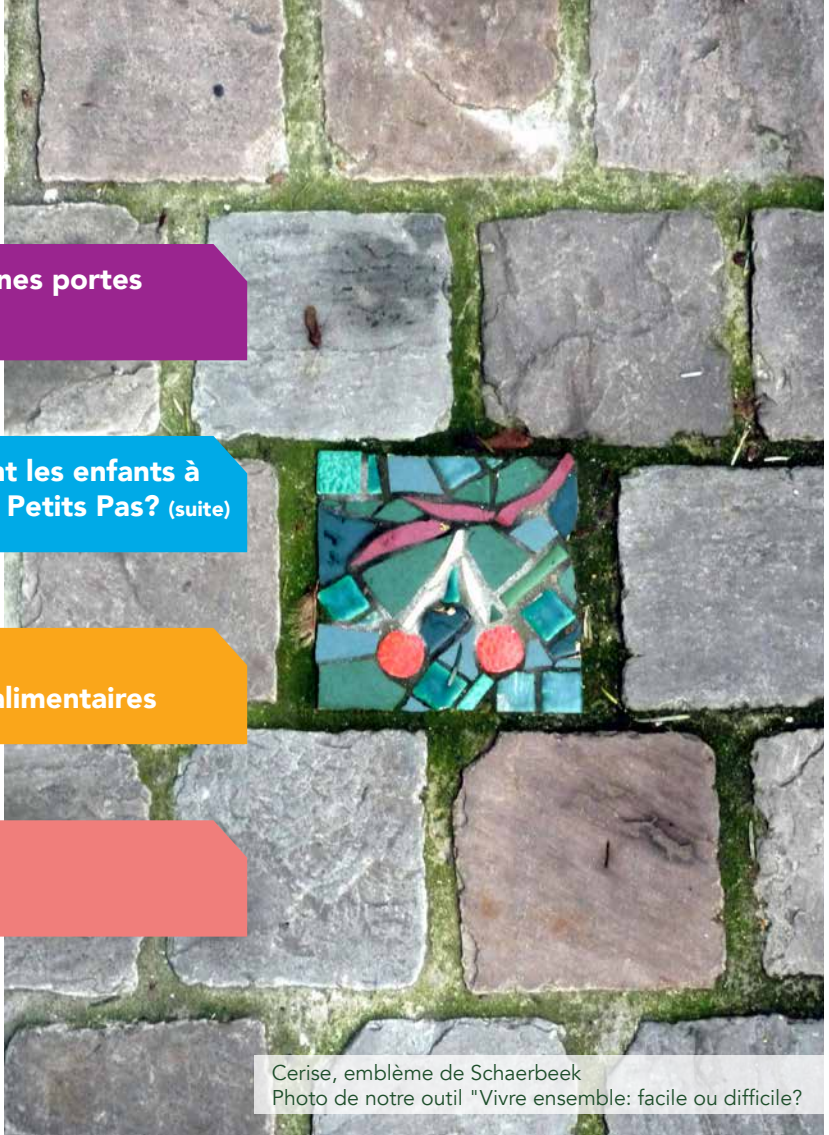
Cerise, emblème de Schaerbeek Photo de notre outil "Vivre ensemble: facile ou difficile?"